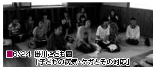
6/24 掛川子ども園 「子どもの病気・ケガとその対応」