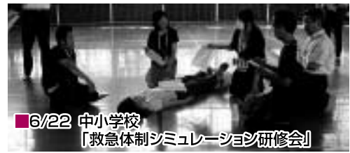
6/22 中小学校 「救急体制シミュレーション研修会」