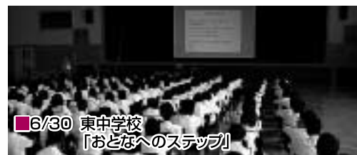
6/30 東中学校 「おとなへのステップ」