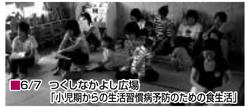
6/7 つくしなかよし広場 「小児期からの生活習慣病予防のための食生活」