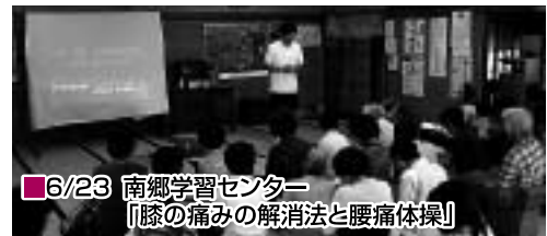
6/23 南郷学習センター 「膝の痛みの解消法と腰痛体操」