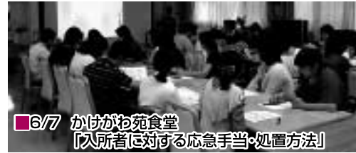
6/7 かけがわ苑食堂 「入所者に対する応急手当・処置方法」