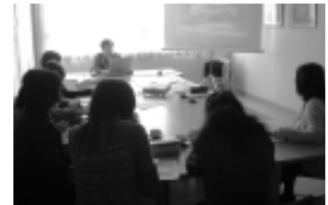
市内学校研修会でおこなわれた「睡眠について」