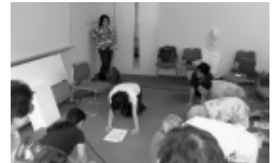
市内サークルでおこなわれた「膝の痛み、肩の痛みの解消法」