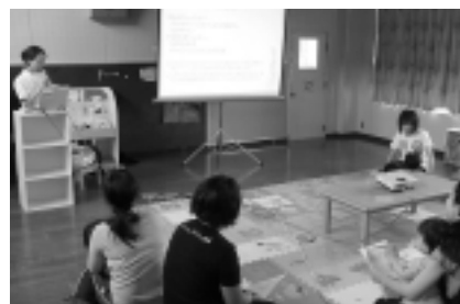
市内子育て支援サークルでおこなわれた「小児の正しい薬の飲み方・使い方」