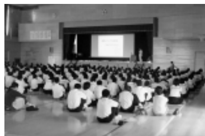
市内中学校でおこなわれた「薬物について」