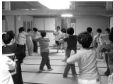
膝の痛みの解消法と腰痛体操