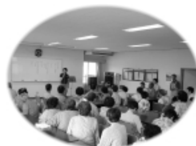
膝の痛みの解消法と腰痛体操

地域に開かれた病院であるために、また、市民の皆さまにもっと病院を知ってもらおうということで、秋に病院まつりを企画しています。準備委員会が立ち上がり、内容の話し合いがされています。連携室でも地域と病院を繋ぐための活動の報告と宣伝をしたいと考えています。