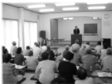
生活習慣病予防について