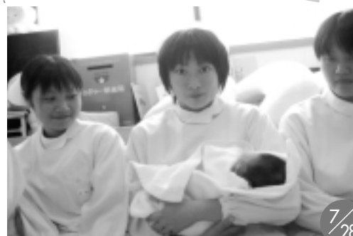
7/28 1日ナース事業「赤ちゃんはなんでもカワイイ~」