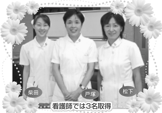
看護師では3名取得