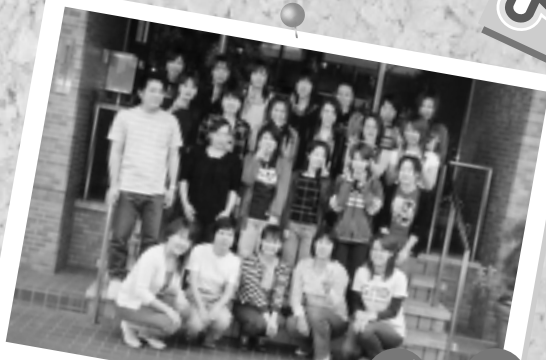
5/18 5/19 浜名湖 観月園にて 基礎 宿泊研修