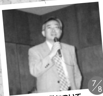
7/8 静脈血栓症予防について 信州大学医学部教授 小林隆夫氏