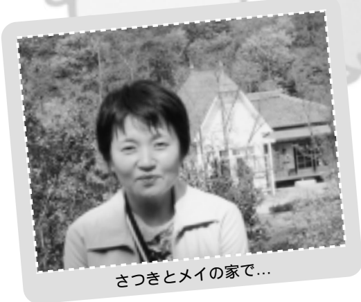
さつきとメイの家で...

三好駐車場からは東ゲートに送迎バスで降ろされる事、整理券、当日券情報は入り口でおさえる事がポイントになるかな？