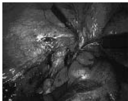
図3 腹腔鏡大腸切除術時の腹腔内風景

腹腔内の状況は、図3の如くであり、先の小さな鉗子で組織を把持し、主に電気メスで切離する操作が続きます。