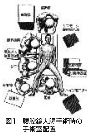
図1 腹腔鏡大腸手術時の手術室配置

大腸手術を例にとり説明します。手術室の配置を示しますが、手術室内は、様々な機械で煩雑な状態になります(図1)。