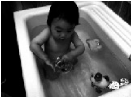
お泊りでお風呂中

べ、お風呂も美女二人に囲まれて、玩具で遊び楽しい時間、頭も洗ってサッパリしました。指を吸い出すと「眠いよー」の合図、片方の手は保育士の胸をちよつと拝借して「ママと違うなー」でも、これで安心とばかりに眠りにつきます。