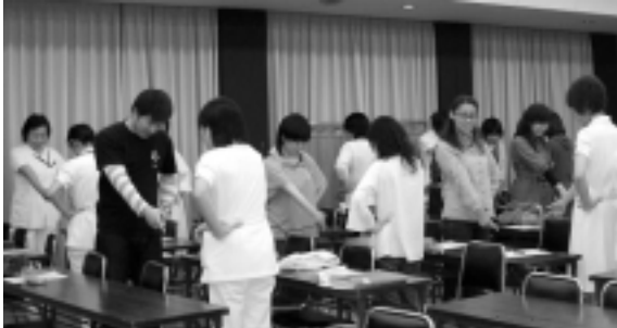
指差し呼称の練習中

看護部の今年度の目標とする指差し呼称について、5月22日にJR掛川駅長の 大塚氏による講演会が行われました。指差し呼称は駅長さんが業務で行っている行為ですが、看護師のヒューマンエラー防止策としても取り入れたい行為です。駅長さんからはムリ、ムダ、ムラのない作業方法の改善、マニュアルの整備についても取り組むことがエラーをなくす方法であること。ミスをしたときは「なぜ、なぜ」を繰り返して掘り下げ「だから、だから」で確認すること。またKYT(危険にたいする予知を高める)の必要性についての講義がありました。指差しは全員で実施し、意識を集中する方法を学ぶ事ができました。