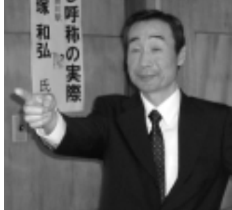
掛川駅の駅長さん