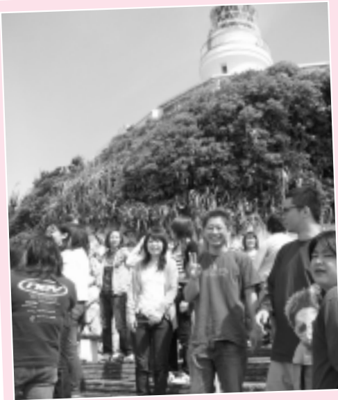
H19年5月16~17日 in御前崎 灯台の見える所で研修しました。

返りましたが、伝えたいことが多すぎて上手にまとめることができませんでした。それだけ一年間で得たものは多かったんだと実感しました。