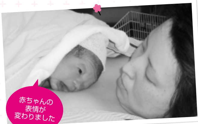
赤ちゃんの表情が 変わりました