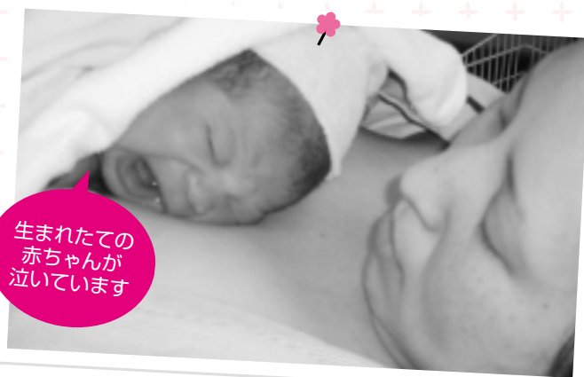
生まれたての 赤ちゃんが 泣いています