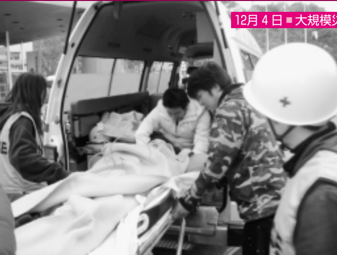
12月4日 ■ 大規模災害時初期対応訓練