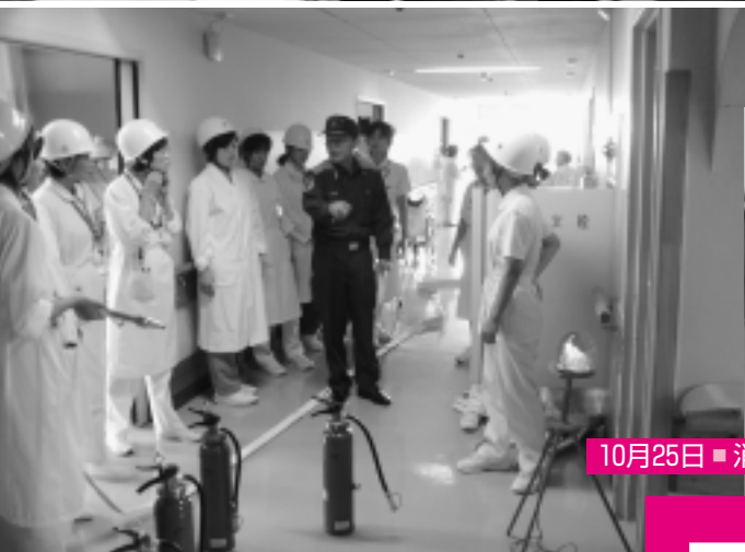
10月25日 ■ 消防防災訓練