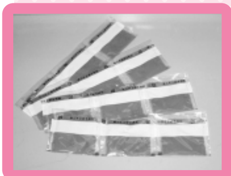
掛川茶を使った緑茶粉末