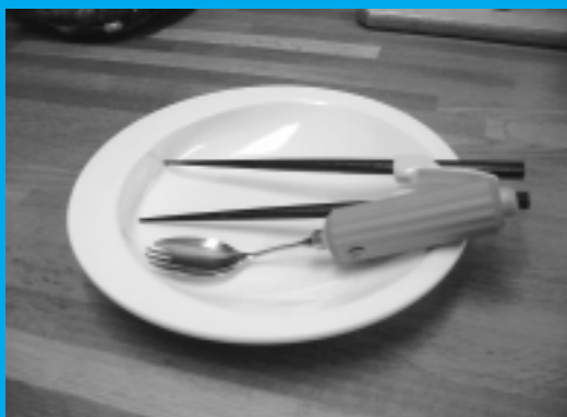
食事の訓練に使用する皿、箸、スプーンです