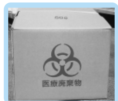
バイオハザードマーク