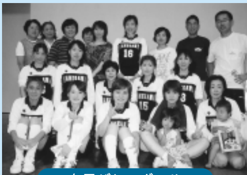
女子バレーボール

れた女子のバレーボール、共に優勝という快挙を成し遂げました。選手の皆さん、お疲れさまでした。また、応援に駆けつけてくれた皆さんの皆さん、本当にありがとうございました。