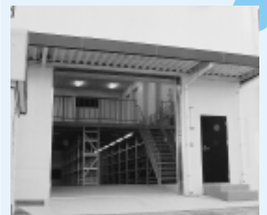
腎センター下に完成した防災倉庫