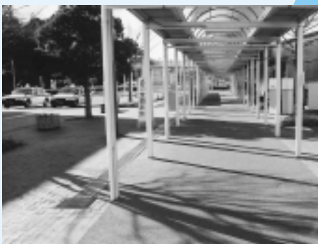
リニューアルした玄関通路

そ して、玄関通路舗装工事は、バ リアフリー対応を目指し、正面 玄関から一般車両ロータリー前まで の通路を舗装しました。9月に完成 した車いす収納庫にある、ロータ リーから近くて便利な車いすを是非 ご利用ください。 工 事期間、皆様には何かとご不便 をお掛けしました。これまでの ご協力に感謝するとともに今後とも 一層のご愛顧をお願い申し上げます。