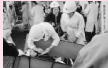
患者容体情報などタグに記入