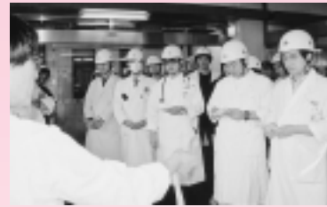
訓練前、トリアージ判断基準の説明と再確認