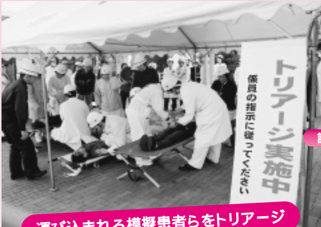
運び込まれる模擬患者らをトリアージ